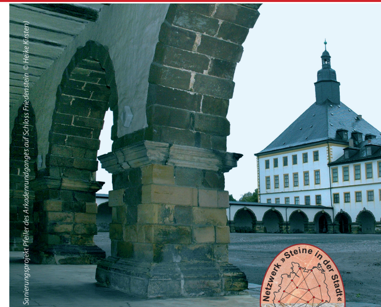
Sanierungsprojekt Pfeiler des Akademieringanges auf Schloss Friedenstein

◀ Herzogliches Museum Gotha